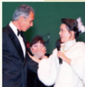
Bill Conti amerykański kompozytor zdobywca Oscara i nagrody Emmy

na koncercie dobroczynnym Jeden świat... pokoju poprzez muzykę w Los Angeles, Kalifornia, USA (1998)