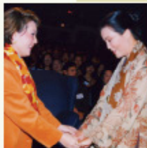
Ki êu Chinh znana aulacka (wietnamska) aktorka

ze słynnego zespołu Beach Boys Family & Friends na koncercie dobroczynnym Jeden świat... pokoju poprzez muzykę w Los Angeles, Kalifornia, USA (1998)