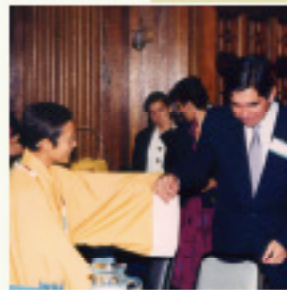
Prezydent Óscar Arias Sánchez