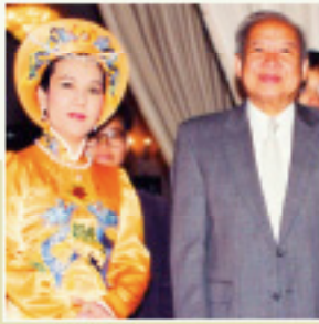
Król Preah Bat Samdech Preah Norodom Sihanouk Varman

powitał Najwyższą Mistrzynię Ching Hai w swoim królewskim pałacu w Kambodży i podarował jej wazę w dowód przyjaźni (1996)