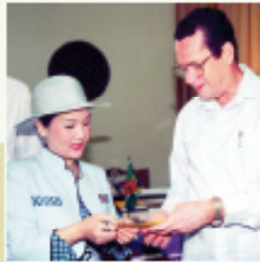
Prezydent Crispin Sorhaindo