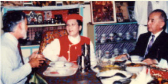
Konsulowie amerykański i japoński

powitali Najwyższą Mistrzynię Ching Hai w Indonezji (1993)