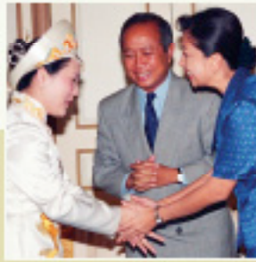
Księżę Norodom Ranariddh i księżna Marie Ranariddh

powitał Najwyższą Mistrzynię Ching Hai w swoim królewskim pałacu w Kambodży i podarował jej wazę w dowód przyjaźni (1996)