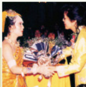
Sudarat Keyuraphan zastępca rzecznika rządu