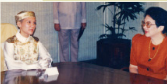
Prezydent Corazón Cojuangco-Aquino

powitali Najwyższą Mistrzynię Ching Hai w Indonezji (1993)