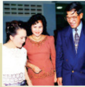
Premier Samdech Hun Sen z żoną Bun Ramy