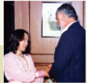
Peter Spalding Główny dowódca Amerykańskich Sił Zagranicznych