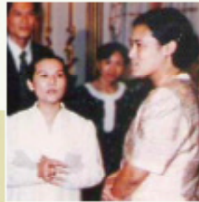
Księżniczka Maha Chakri Sirindhorn