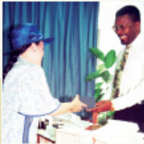
Premier Edison James