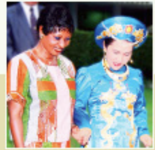
Pierwsza Dama Henriette Bedié