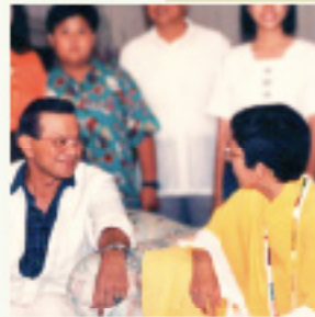
Wiceprezydent Salvador Laurel