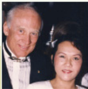
Amerykański astronauta Buzz Aldrin

Sławny amerykański aktor 19 coroczna gala dobroczynna dla szpitala St. Jude Children's Research w Beverly Hills, Kalifornia, USA (1999)